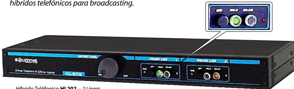
Híbrido Telefónico HL202 - 2 Líneas.

Pueden operar con cualquier modelo de consola. El gabinete tiene orejas rebatibles para ser montado en rack o bien operar sobre una mesa. El rechazo supera los 40dB y la calidad de audio es tan buena que asombra que sea originada en una línea de teléfono.